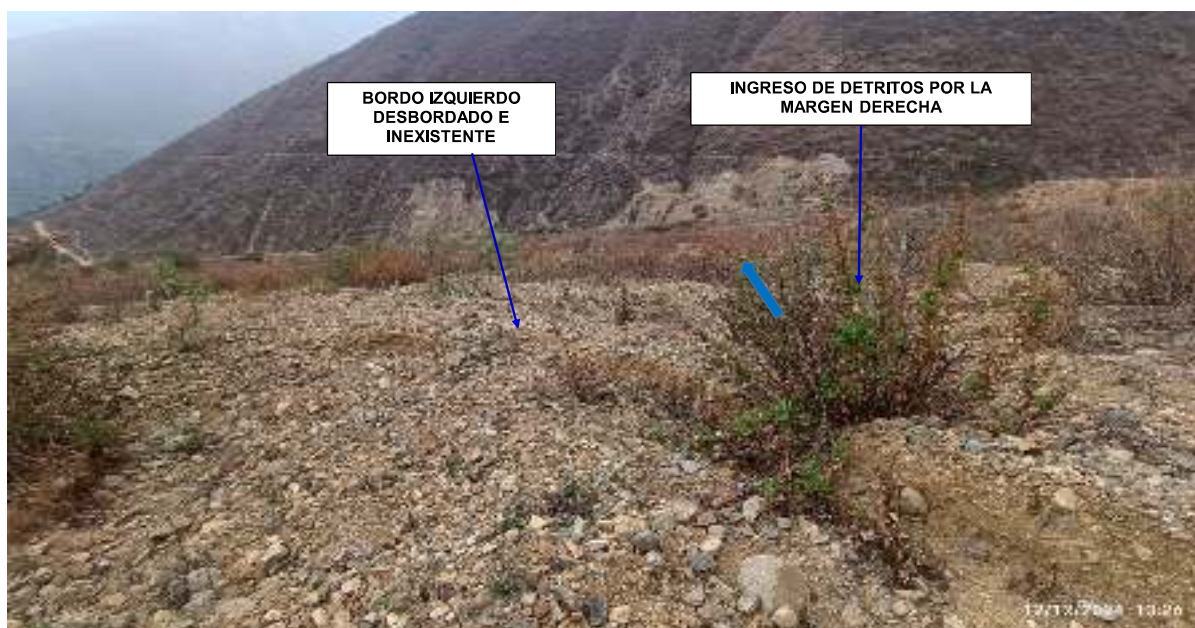
FIGURA N°03: TRAMO DE LA QUEBRADA JILICHUY SE ENCUENTRA COLMATADO CON DESBORDE HACIA EL CENTRO POBLADO DE CUCAPUNCO.