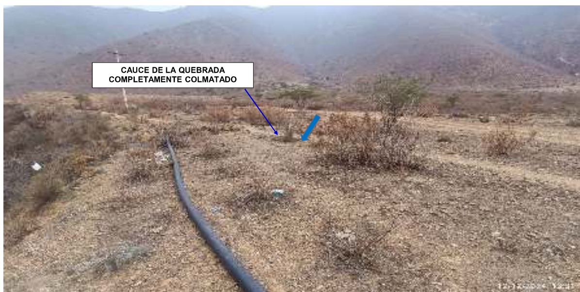
FIGURA N°04: EL TRAMO FINAL DEL CAUCE DE LA QUEBRADA JILICHUY SE ENCUENTRA COLMATADO, CON EVIDENCIA DE QUE EL CAUDAL CAMBIA DE RUMBI HACIA LA MARGEN IZQUIERDA, ES DECIR, HACIA LAS VIVIENDAS DEL CENTRO POBLADO DE CUCAPUNCO DE LA COMUNIDAD CAMPESINA DE SUMBILCA.