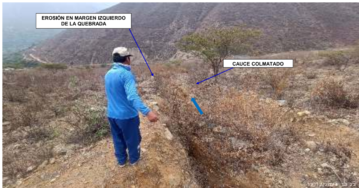
FIGURA N°01: UBICACION DE LA QUEBRADA JILICHUY QUE SE ENCUENTRA COLMATADO A LA ALTURA DEL CENTRO POBLADO DE CUCAPUNCO DE LA COMUNIDAD CAMPESINA Y DISTRITO DE SUMBILCA, PROVINCIA DE HUARAL - LIMA.