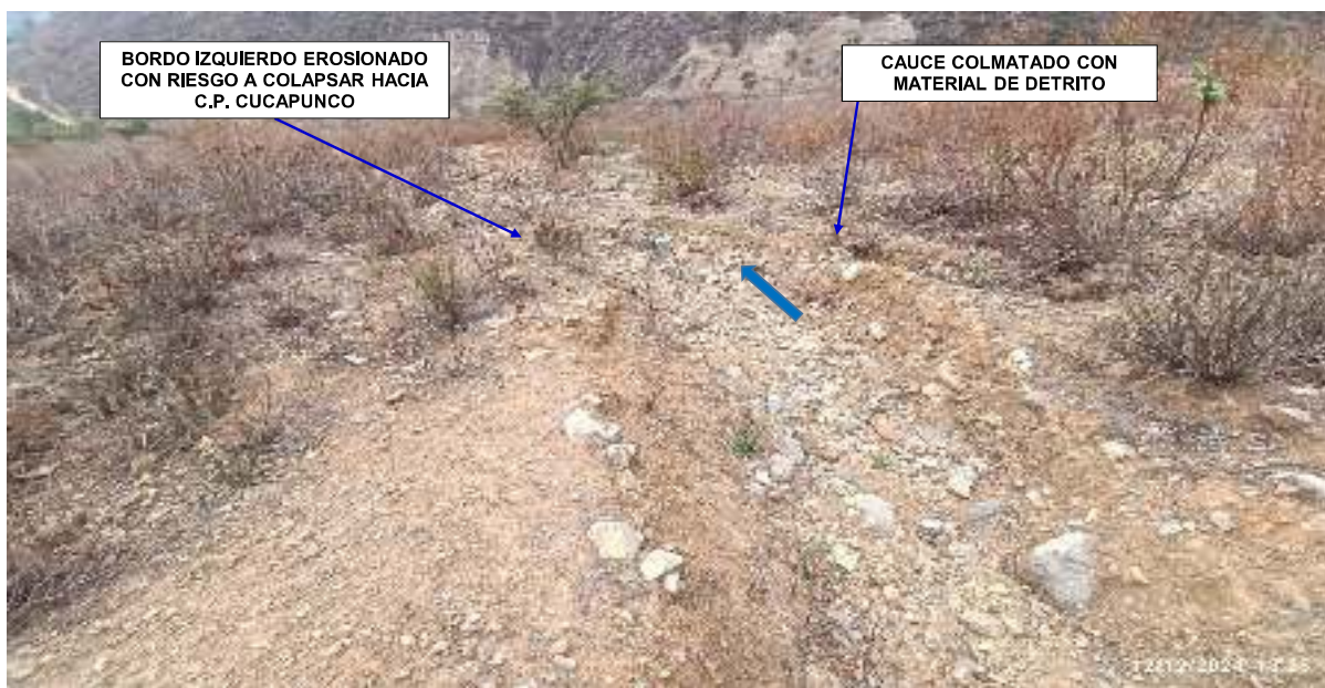
FIGURA N°02: CAUCE COLMATADO CON FLUJO DE DETRITOS, EN LA MARGEN DERECHA EXISTEN INGRESOS DE SEDIMENTOS POR PRECIPITACIONES PLUVIALES; BORDO DE LA MARGEN IZQUIERDA SE ENCUENTRA EROSIONADO CON RIESGO DE DESBORDARSE HACIA C.C.